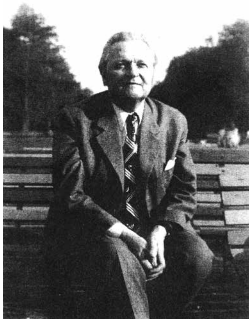
Obr. 10: Mezi nejvýznamnější teoretiky v oblasti muzejní pedagogiky a prezentace patřil Josef Beneš (1917–2005)

Slezský zemský archiv Opava, fond Krajská správa Sboru národní bezpečnosti – správa Státní bezpečnosti Ostrava (částečně zprac.), Brožura Síň tradic Krajské správy SNB Ostrava .