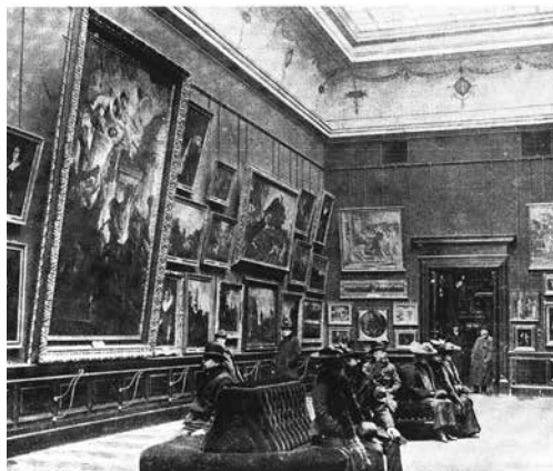
Obr. 3: Návštěvníci v sále nizozemského a italského umění OSVPU (1911)

FRIČ, Antonín. Návrh k zřízení přírodnického Musea. Časopis Musea Království českého , 1865, roč. 39, s. 330.