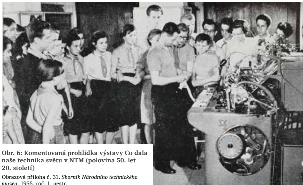
Obr. 6: Komentovaná prohlídka výstavy Co dala naše technika světu v NTM (polovina 50. let 20. století)

Heldendenkmal im Schöllschitzer Museum. Morgenpost , 1943, roč. 78, č. 235, s. 3.