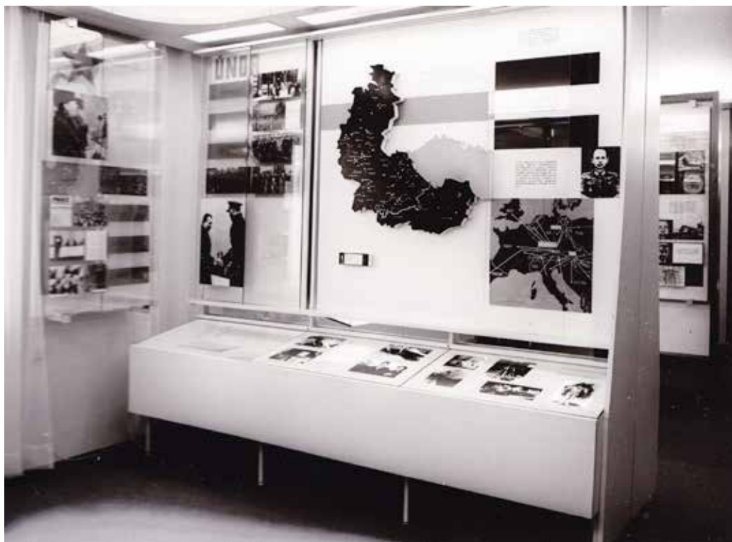
Obr. 9: Síň tradic Krajské správy Sboru národní bezpečnosti Ostrava (80. léta 20. století)

Slezský zemský archiv Opava, fond Krajská správa Sboru národní bezpečnosti – správa Státní bezpečnosti Ostrava (částečně zprac.), Brožura Síň tradic Krajské správy SNB Ostrava .