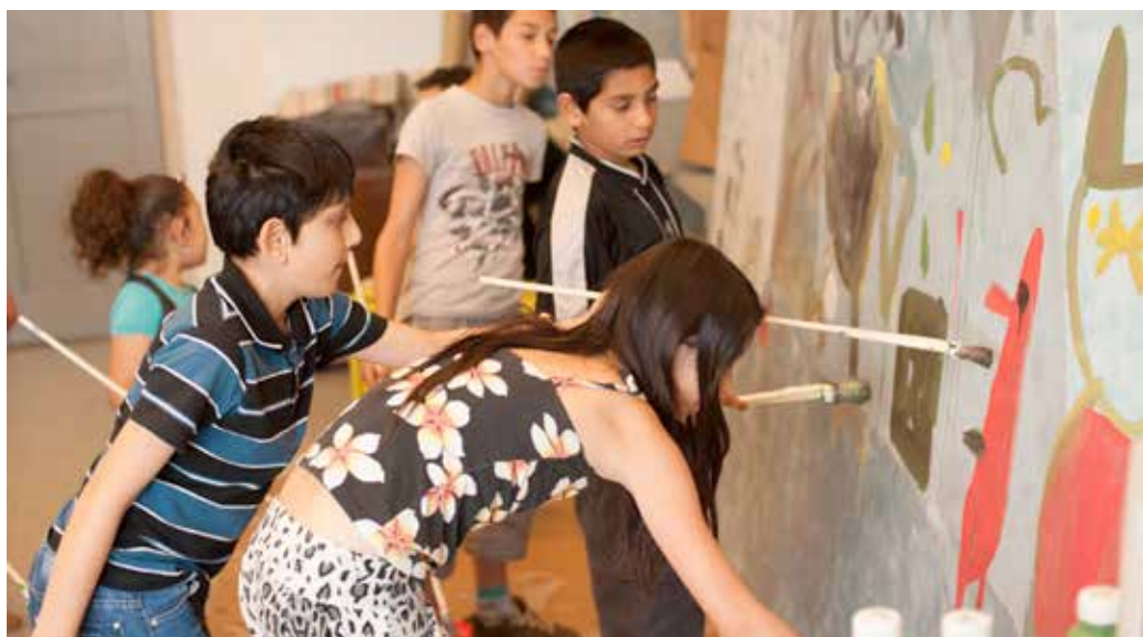
Obr. 12: Ukázka ze současné edukace v muzejní praxi – projekt „Umění spojení“ Lektorského centra GASK v Kutné Hoře (2014)