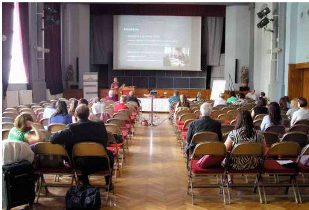
Obr. 11: Muzeologický seminář v Masarykově muzeu v Hodoníně k problematice potenciálu muzejních pracovníků „nepedagogické“ profilace směrem k muzejnímu publiku (2015)