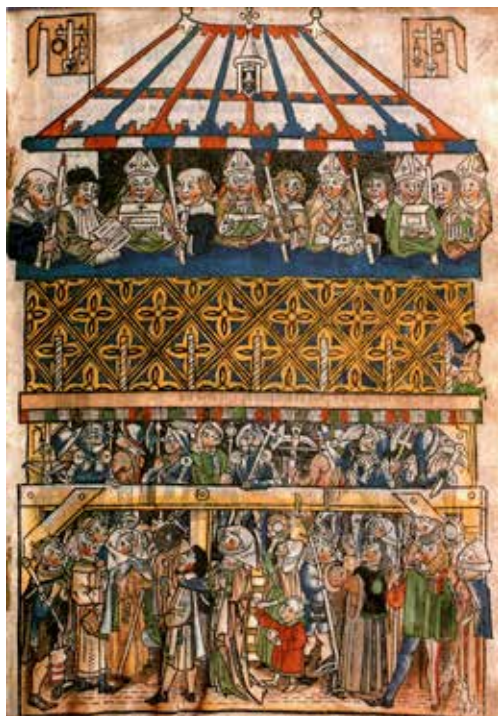
Obr. 1: Ukazování liturgických předmětů v období vrcholného středověku (Norimberk, začátek 15. století)

PLETICHA, Heinrich. Des Reiches Glanz: Reichskleinodien und Kaiserkrönungen im Spiegel der deutschen Geschichte . Freiburg im Breisgau: Herder, 1989, s. 143. ISBN 3-451-21257-9.