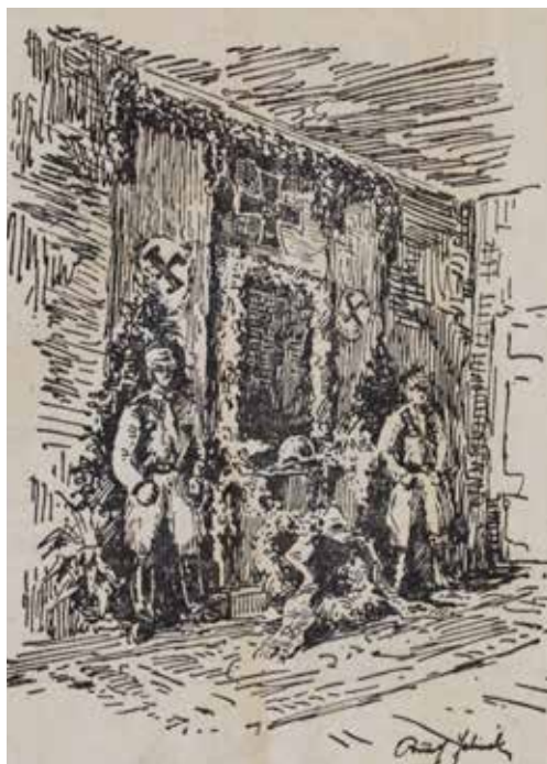
Obr. 5: Památník padlých hrdinů (Heldendenkmal) v reprezentativním sále železničského muzea (začátek 40. let 20. století, kresba Rudolf Jelinek)

Heldendenkmal im Schöllschitzer Museum. Morgenpost , 1943, roč. 78, č. 235, s. 3.