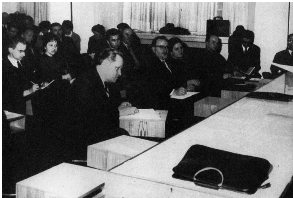
Obr. 7: Pro rozvoj vztahu odborných zaměstnanců k návštěvníkovi sehrál důležitou roli také nově se rozvíjející obor – muzeologie. Momentka ze zasedání prvního muzeologického symposia v Brně (1965)

STRÁNSKÝ, Zbyněk Z. STRÁNSKÝ, Zbyněk Z. 150 let Moravského muzea v Brně: 1818–1968: katalog jubilejní výstavy . Brno: Moravské muzeum, 1968, nestr.